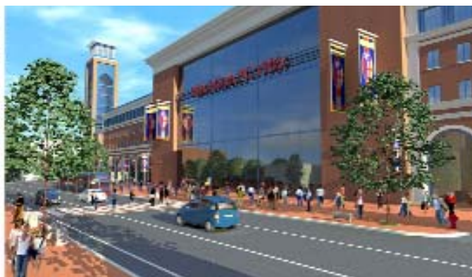
via Andrea Costa, DOPO Nuovo Ingresso allo Stadio