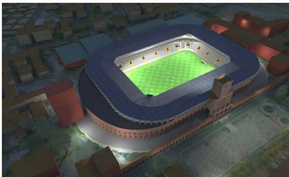
La Nuova Città dello Sport all'interno del Quartiere Andrea Costa di Bologna