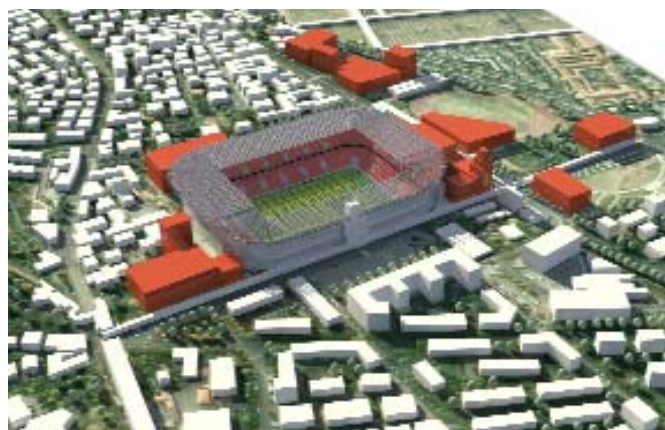
Planimetria e Vista volumetrica della Nuova Città dello Sport all'interno del Quartiere Andrea Costa di Bologna

Il Book del Progetto della Nuova Città dello Sport di Bologna è disponibile on-line: www.avoe.org/bologna2020.html